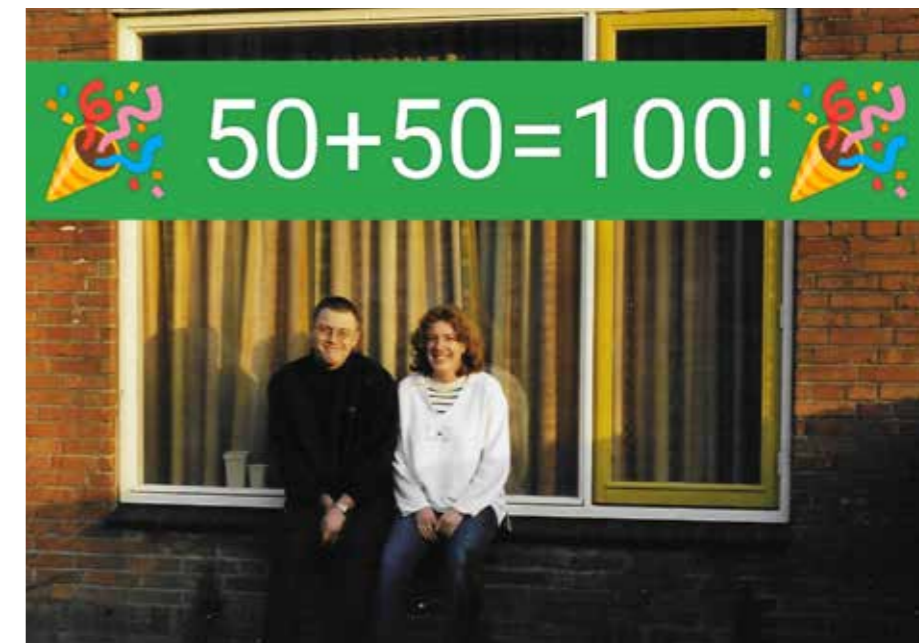
Dit koppel wordt deze maand samen 100 jaar! Felicitier ze met een kaartje: weijkmanlaan 22, 4511CS Breskens