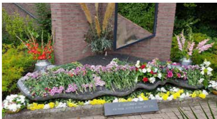
Herdenking bombardement 11 september.