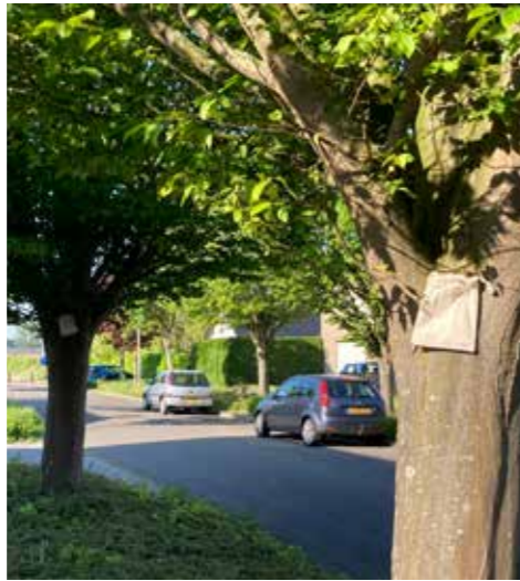
Zakjes met larven van lieverheersbeestjes tegen bestrijding van bladluis