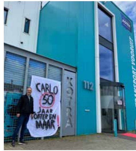
Op 11 mei j.l. veranderde de manager van Transport Vooruit van vlotte veertiger naar kwieke vijftiger. De collega's hadden hem er op ludieke wijze aan herinnerd.