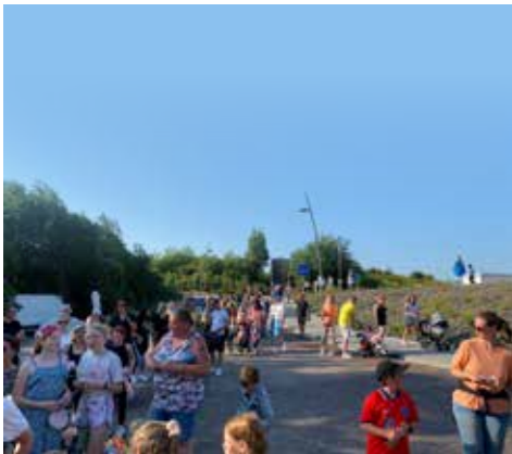
Avondvierdaagse was weer een groot succes! Op naar volgend jaar!