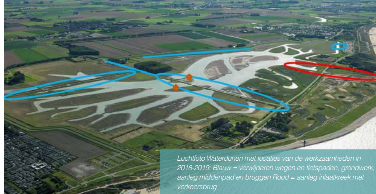
Luchtfoto Waterdunen met locaties van de werkzaamheden in 2018-2019: Blauw = verwijderen wegen en fietspaden, grondwerk, aanleg middenpad en bruggen Rood = aanleg inlaatkreek met verkeersbrug

Aannemer Romers Grondverzet is al begonnen met de voorbereidingen: de resten van kabels en leidingen worden nu uit de grond gehaald. Daarna wordt extra bodemonderzoek gedaan, voordat na de zomer het asfalt wordt verwijderd van de stukken Slikkenburgseweg en Langeweg binnen het gebied. Als dit werk klaar is, kunnen de geulen helemaal worden afgemaakt. Begin 2019 zal de aannemer de eerste delen van de bruggen en vlonders van het middenpad plaatsen. Ook de brug over de ringsloot die vanaf de Walendijk toegang zal geven tot Waterdunen wordt dan gebouwd.